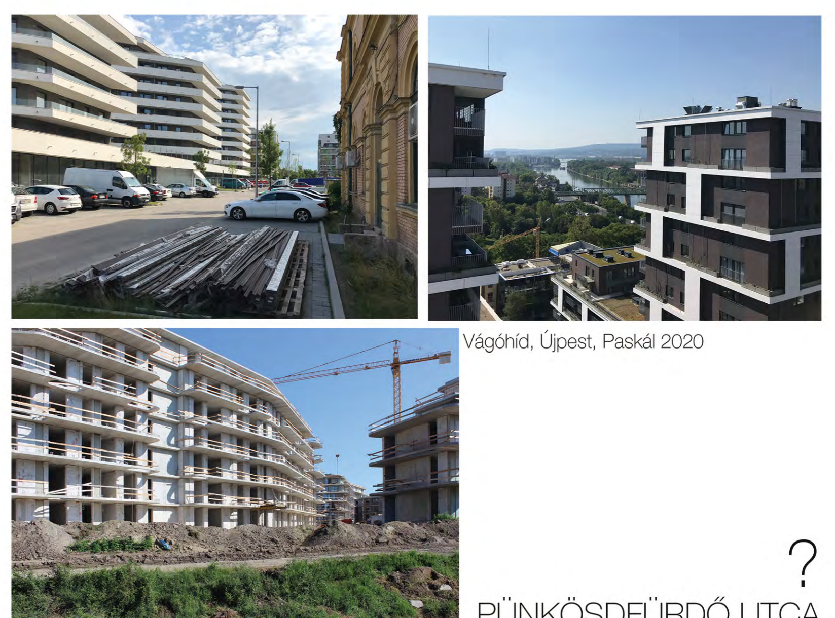
Vágóhid, Újpest, Paskál 2020

In the third phase (7 weeks) students worked on their individual architectural housing projects related to their former urban concept.