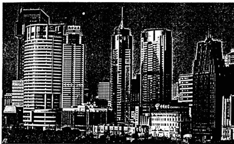
Sanghaji látkép. Sok jó ember kis helyen

*2006-ban álló vagy épülő toronyházak. **90 méter fölötti részek összege méterben. Irodák vagy lakások nélküli (például antenna-) tornyoknál csak a fele számít.