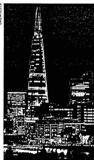
Az Uborka (London), a befejezetlen Ryugyong Hotel (Phenjan) és a tervezett Üvegszilánk (London). Csúcsprofit nélkül