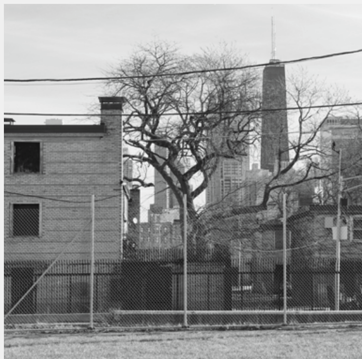
A SORHÁZAK ELSŐ ÜTEME.

A háború után azonban a magasházak, az amerikai szóhasználatban liftes házak (elevator building) építése a szövetségi szociális lakáspolitikában előtérbe került. A chicagói lakásügyi hatóság ennek ellenére még középmagas házak kísérleti terveit készítette el. 1945-ben a korábbi sűrűségi mutatókat megtartva, hatszintes, parkban álló liftes házakat terveztek, majd 1955-ben mutatták be a „sorház a sorházon” (row-on-row) koncepciót (ezt a kilencvenes években holland és dán lakófejlesztéseknél valósították meg), 14 ahol a földszinten lévő lakás felett, lift nélküli házban két duplex (kétszintes) lakást helyeztek el. Emellett érezve a washingtoni „magasház” nyomást, a CHA a város elismert építészeit, többet között Skidmore-t (SOM) 15 bízta meg – de még mindig csak hétszintes – lakóházak tervezésével, illetve kísérleteztek emeleti, a közösségi teret nyújtó járdák (sidewalk in the air) kialakításával. A CHA vezetői, ismerve a szociális lakhatás helyi nehézségeit, a családok életvitelét, megpróbálták szembe menni a nemzetközi modern urbanisztikai és építészeti elvekkel. A lakótelepeken a nagycsaládokat, a gyerekeket a föld közelében akarták tartani.