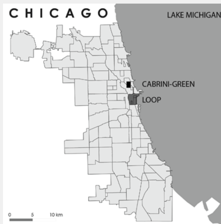
CHICAGO 50 VÁROSNEGYEDBŐL ÁLL, KÖZPONTJA A MICHIGAN TÓ PARTI LOOP. CABRINI-GREEN ETTŐL ÉSZAKNYUGATRA, A VÍZPART KÖZELÉBEN HELYEZKEDIK EL. ÁBRA: TÓTH PÉTER

A „chicagói iskola”, a városszociológia és a humánökológia egyik első és nemzetközileg is legismertebb szellemi műhelye a hihetetlen ütemben fejlődő város térbeli és szociális szegregációját kutatta. Az 1926-os Burgess-féle koncentrikus modell a városközpont (Loop) körüli átmeneti zónát etnikai alapon tagolt nyomortelepekkel jellemzi, míg az 1939-es Hoyt-féle szektormodell a központból kivezető utak a gyűrűs városfejlődést módosító szerepét rögzíti. 7 Chicago ezeknek a tanulmányoknak