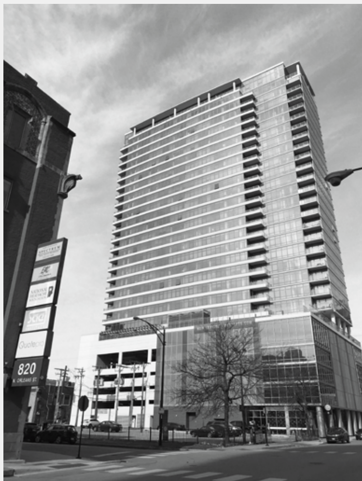
ÚJ MAGAS ÜVEGHOMLOKZATÚ LAKÓÉPÜLET, ELŐTÉRBE AZ ÚJ RENDŐRSÉG. FOTÓ: BENKŐ MELINDA, 2020

viszonylag kis méretűek, az új lakóépületek egyrészt alacsony sorházas telepeket, másrészt közepmagas, az utcavonalon zárt együtteseket alkotnak. Ugyanakkor a volt lakótelep területén és annak határán szoliter házak is megjelentek: új rendőrségi épület, hatalmas zárt raktárház, magas üveg lakótornyok. A társadalmi sokféleséget, a vegyes jövedelmű lakónegyed kialakítását a lakásmegoszlásra vonatkozó előírások formálják: az új lakások 50%-a piaci alapon értékesíthető, 20%-a támogatott megfizethető (affordable), 30%-a pedig a fejlesztésbe „láthatatlanul” beépített szociális bérlakás. 29