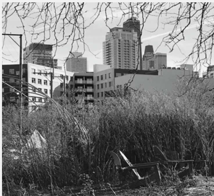
A BONTÁS NYOMAI, HÁTTERBEN AZ ÚJ FEJLESZTÉSEK. FOTÓ: BENKŐ MELINDA, 2020

A második világháború után az 1949-es központi lakástörvény még nagyobb álmokat szőtt, kimondta, hogy cél „minden amerikainak megfelelő minőségű, biztonságos, egészséges lakókörnyezet biztosítása”. 16 Mennyiségi termelésre és gyorsaságra, vagyis tömeges lakásépítésre törekedtek, ahol a jogászok és közgazdászok által irányított szövetségi lakáspolitikai sikerét az újonnan épített lakások száma adta. 17 Mindenhol sűrű magasházak lakótelepek tervezése lett a kötelező.