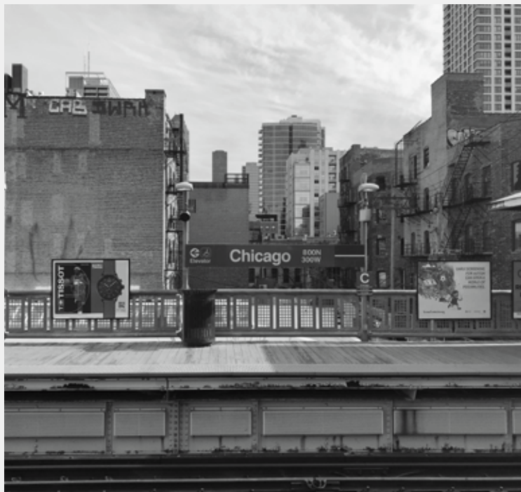
MAGASVASÚT ÁLLOMÁS A TERÜLET DÉLKELETI SARKÁN. FOTÓ: BENKŐ MELINDA, 2020

A lakótelepekről az MÉ 2014/2 számában indult cikksorozat hatodik állomása – Grenoble, Magdeburg, Vilnius, Barcelona, Riga után – Chicago. 1