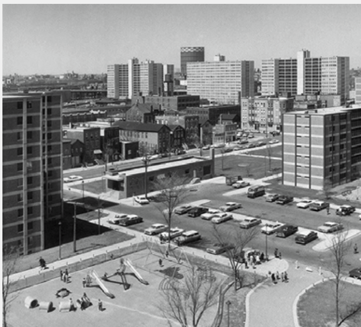
A MAGASHÁZAS BŐVÍTÉS.