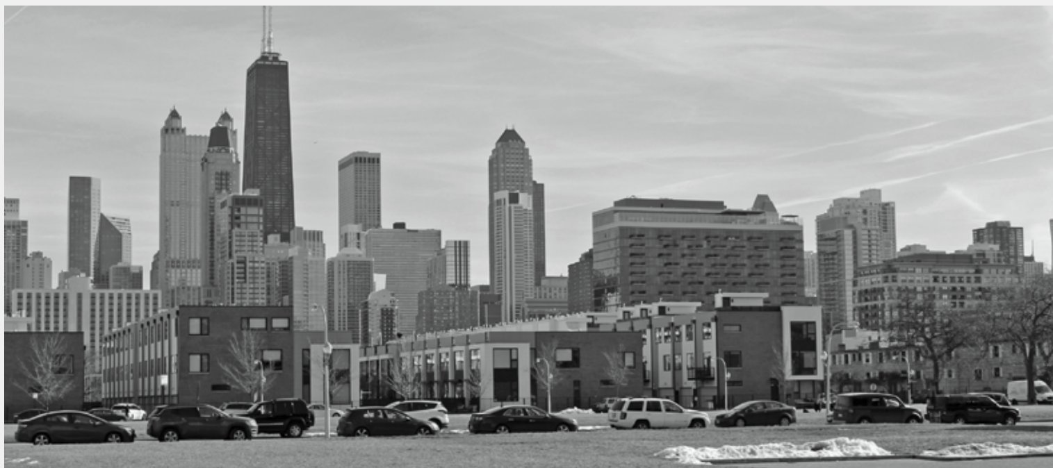
ÚJ SORHÁZAK A MEGÚJULÁSRA VÁRÓ ELZÁRTAK KÖZELÉBEN. FOTÓ: TÓTH PÉTER, 2020

magasházakban él (vagy státuszszimbólumként befektetésként vásárol) a magas jövedelműek egy jelentős része.