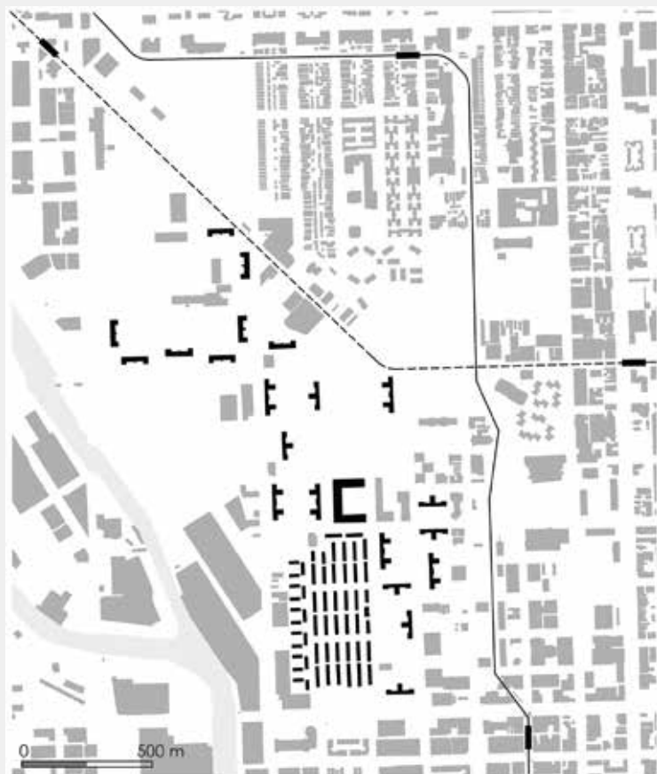
CABRINI-GREEN HELYSZINRAJZA: AZ ELSŐ ÜTEM SORHÁZAI, KÖRÜLÖTTE A MÁSODIK ÜTEM VÖRÖS HÁZAI, ÉSZAKON A HARMADIK ÜTEM FEHÉR TÖMBJEI. A SZERZŐ RAJZA

a terepe, így a CHA szociális lakásépítése is ennek megfelelően a Loop körüli „fekete gyűrű”-ként nevesült rész, illetve a déli iparnegyedek felé vezető főtengety menti nyomornegyedek felszámolását tűzte ki céljává. Kezdetben, az 1930-as évek végén társadalmilag vegyes összetételű, kertvárosi, alacsony intenzív beépítésű szociális lakótelepeket terveztek a város határára. Ezt az idealista elképzelést azonban gyorsan átírta a valóság politikai és gazdasági kényszere. A tömeges lakásépítés új telepei magasházak lettek, és a korábbi, többségében afroamerikaiak által lakott nyomortelepek helyén épültek fel. A városon belüli faji elkülönülés újratermelődött. 8