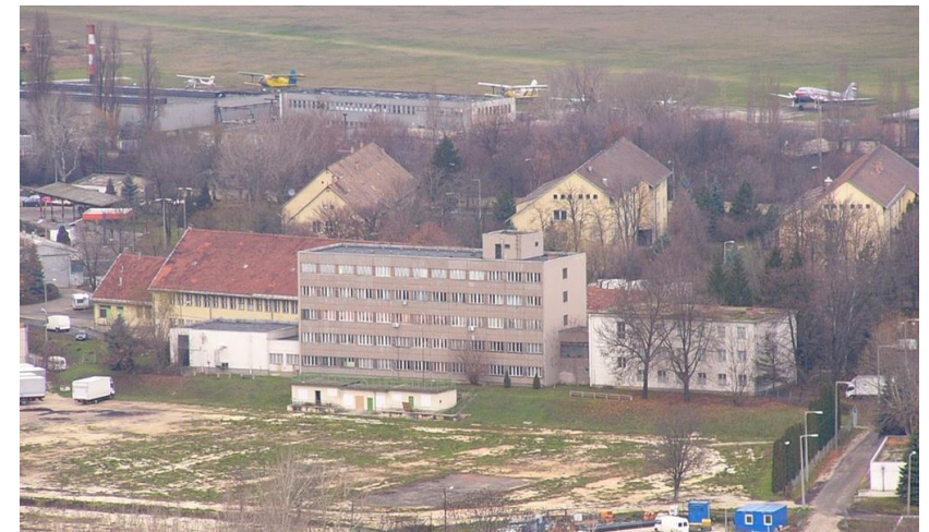
Budaörsi repülőtér, Vasvári Pál laktanya.