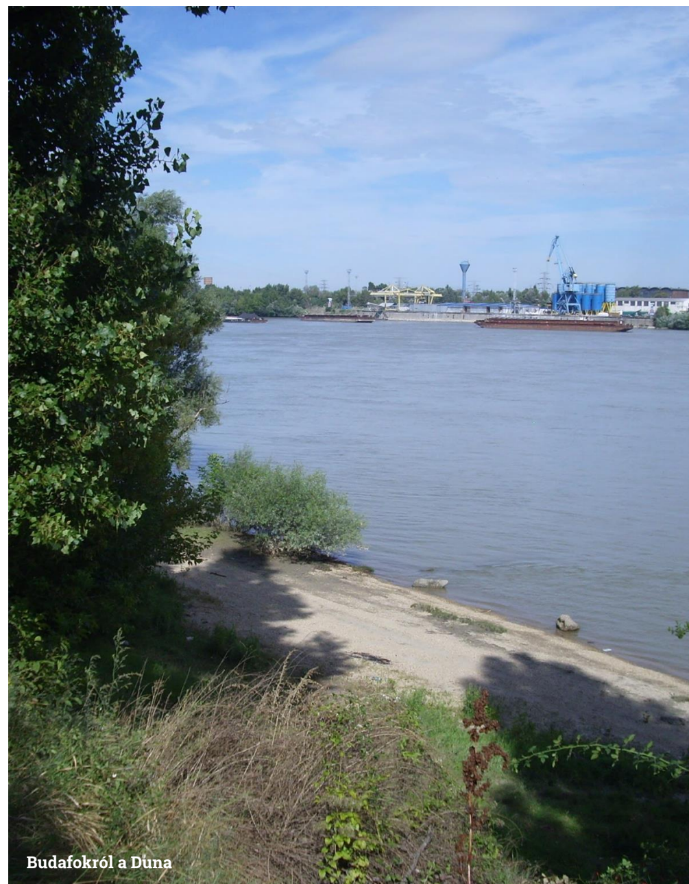
Budafokról a Duna