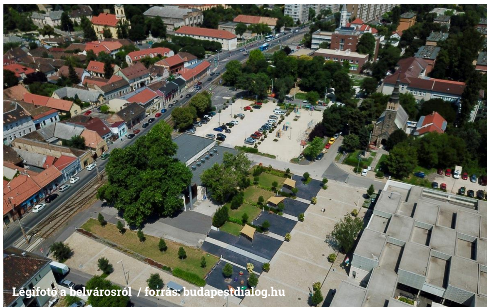
Légifotó a belvárosról