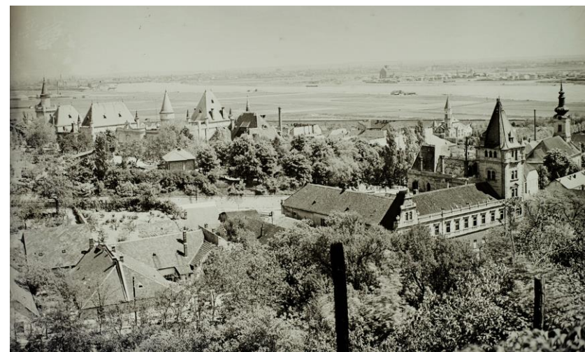
Budafok, kilátás a Hegybíró utcától a Duna felé..