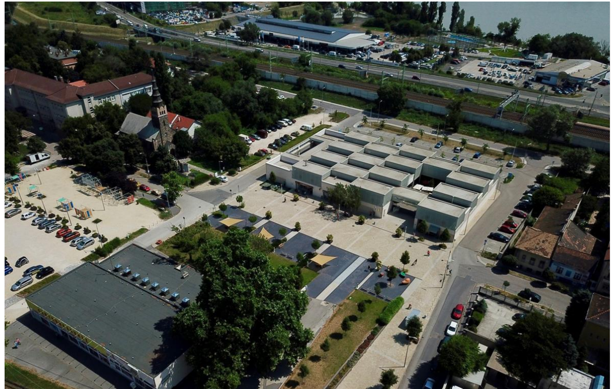
Légifotó az elkészült állapotról, a még üres telkek és a Duna kapcsolatáról

Az elvégzendő munkarészek egymásra épülnek: társadalmi-, gazdasági- és környezeti értékek feltárása után a területi megújítás koncepcióján a helyi főépítéssel dolgozunk és később beépítési tervet készítünk.