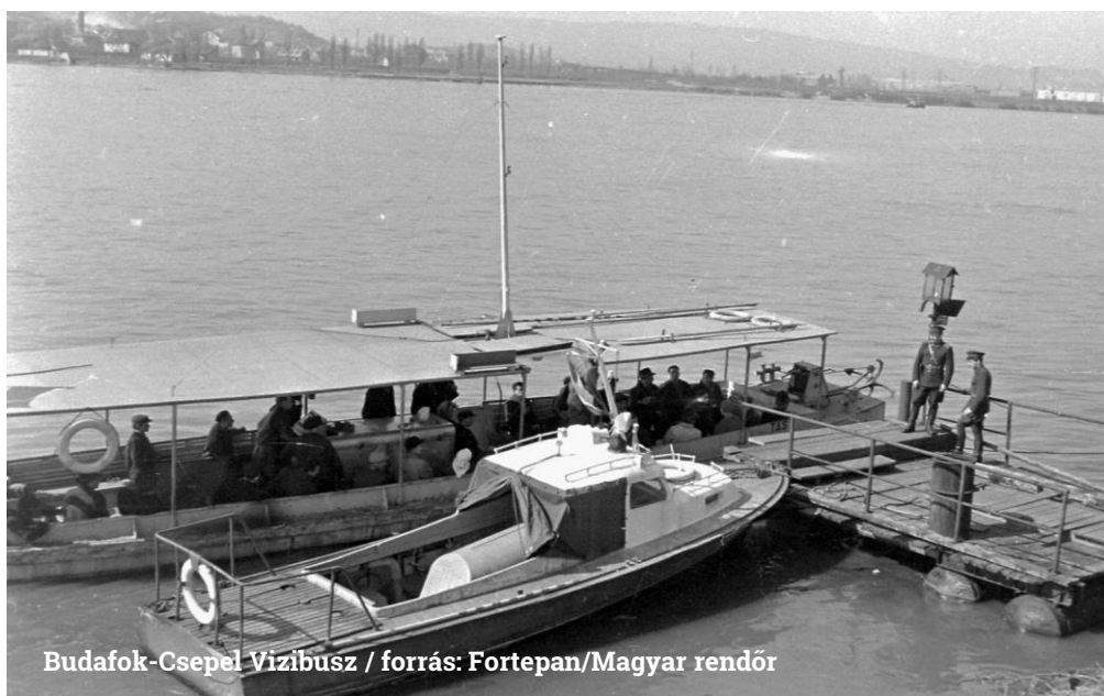
Budafok-Csepel Vízibusz