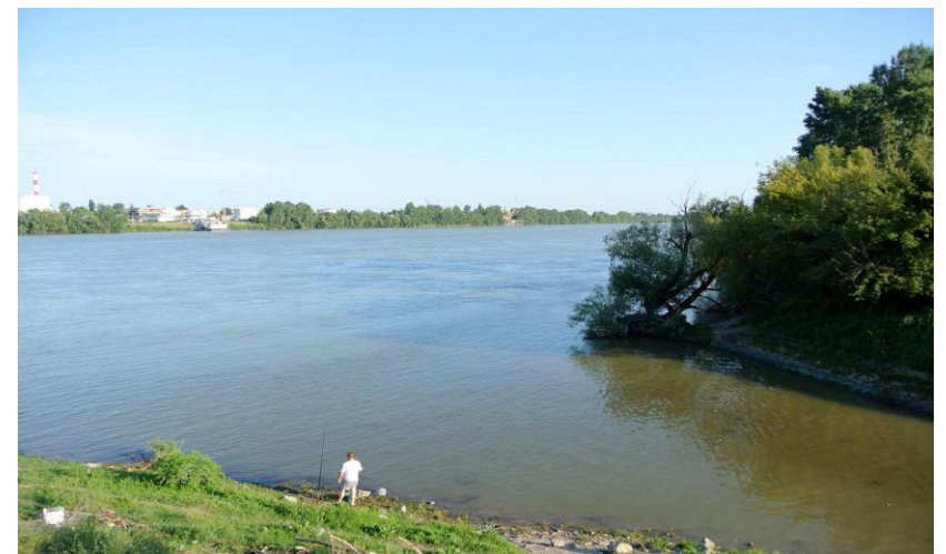
Hosszúrégi patak és a Duna forrás: https://funiq.hu