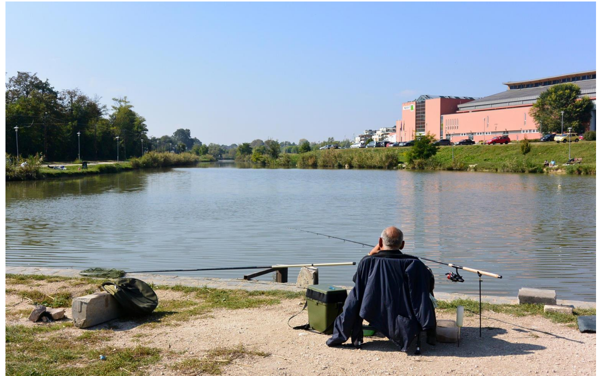
Hosszúréti patak Kána-tó forrás: https://funiq.hu/ .

A félév során mi is azokra a kérdésekre keressük tehát a választ, hogyan oldható meg a városiasodás és a természeti értékek együttes megőrzése, újjáteremtése.