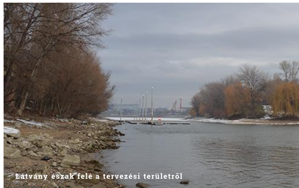
Látvány észak felé a tervezési területről