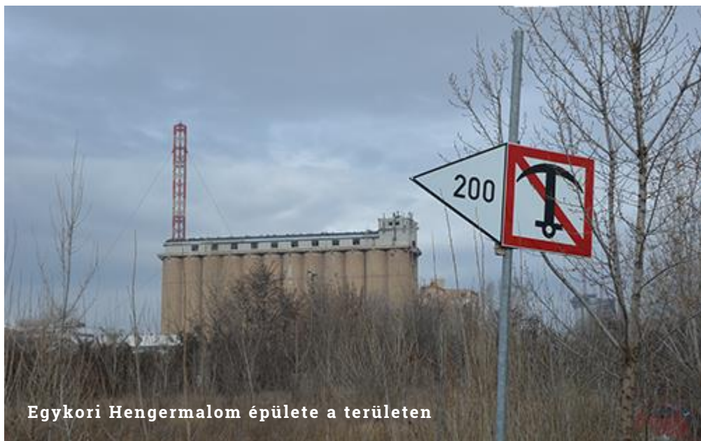
Egykori Hengermalom épülete a területen